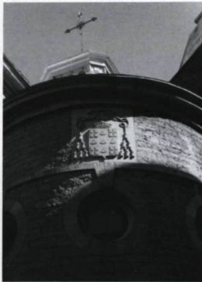
Armoiries épiscopales de François de Laval sculptées au sommet de l'abside de la chapelle funéraire érigée en 1949 au séminaire de Québec. Au dessus de l'écu est gravée la devise des Montmorency «Dieu ayde au premier baron chrestien» et le sigle du séminaire des Missions étrangères. (Photo Yves Beauregard, 1993).