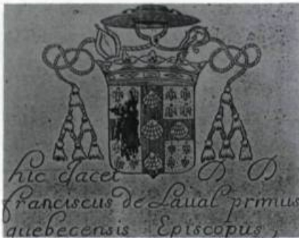
Armoiries épiscopales du François de Laval gravées sur le cercueil de plomb occupé par sa dépouille de 1708 à 1878. (Musée du Séminaire de Québec.).