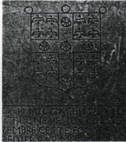
Sur cette pierre de fondation de l'église de Montigny-sur-Avre (Eure-et-Loire) apparaissent les armes d'Hugues de Laval, père de François. (Archives de l'auteur).