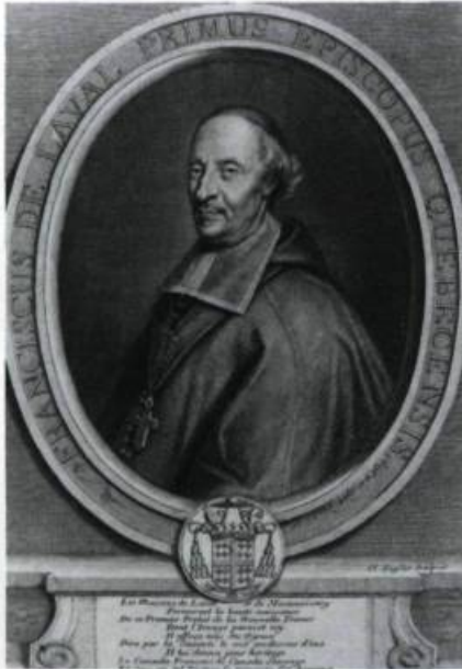
Sous ce portrait de François de Laval, gravé par Claude Duflos, figurent les armoiries de la famille Montmorency sans les coquilles des Laval.