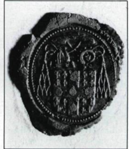
Cachet de François de Laval.