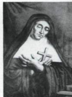
Marie de l'Incarnation (1599-1672), ursuline et auteure de près de 13 000 lettres est un témoin privilégié de l'œuvre de François de Laval.