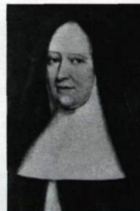
Jeanne-Françoise Juchereau de La Ferté, dite mère de Saint-Ignace, première supérieure de l'Hôtel-Dieu et rédactrice des Annales de l'institution de 1636 à 1716. (Attribué à Jean Guyon. Archives du Monastère des augustines de l'Hôtel-Dieu de Québec).