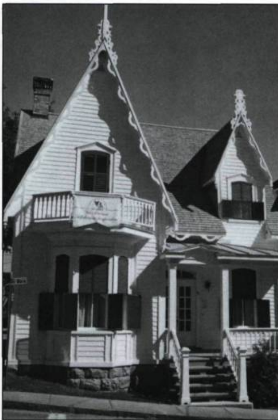
La maison Desjardins à Lévis est devenue un centre d'interprétation de l'histoire ouvert au grand public.

vement Desjardins (1900-1920), la parution de nombreux articles, notamment dans La Revue Desjardins qui consacre une de ses chroniques à l'histoire, ainsi que la rédaction d'un Guide pour la mise en valeur de l'histoire des caisses Desjardins , qui sera bientôt offert aux caisses.