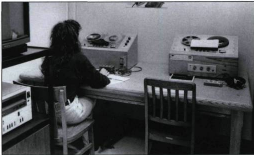
Pavillon Jean-Charles-Bonenfant. Une salle d'écoute et de visionnement.