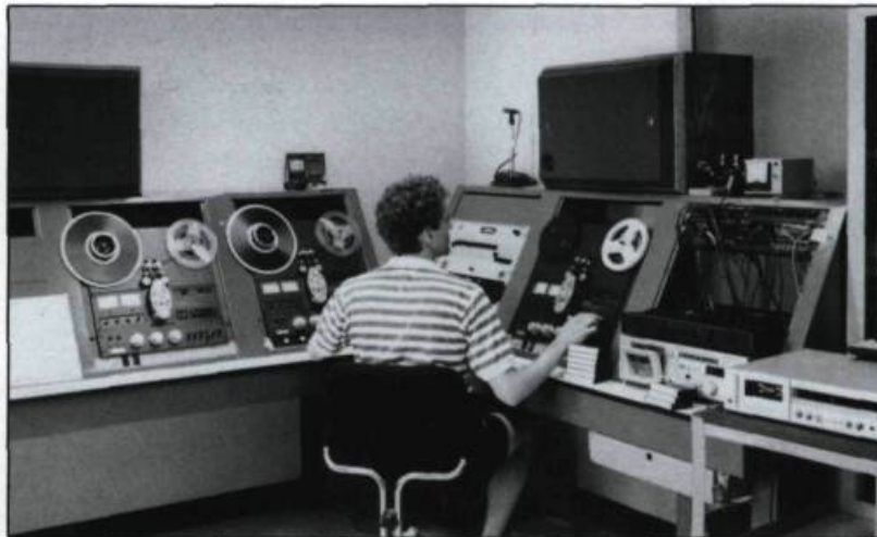
Une partie du laboratoire sonore situé au Pavillon Jean-Charles-Bonenfant.

La fonction «recherche» de la chaire a été prise en charge depuis 1977 par le Célat (Centre d'étude sur la langue, les arts et les traditions populaires des francophones en Amérique du Nord). Depuis 1971, l'enseignement est donné dans un programme offert aux 1 er , 2 e et 3 e cycles des études à la Faculté des lettres, direction des études d'arts et civilisations.