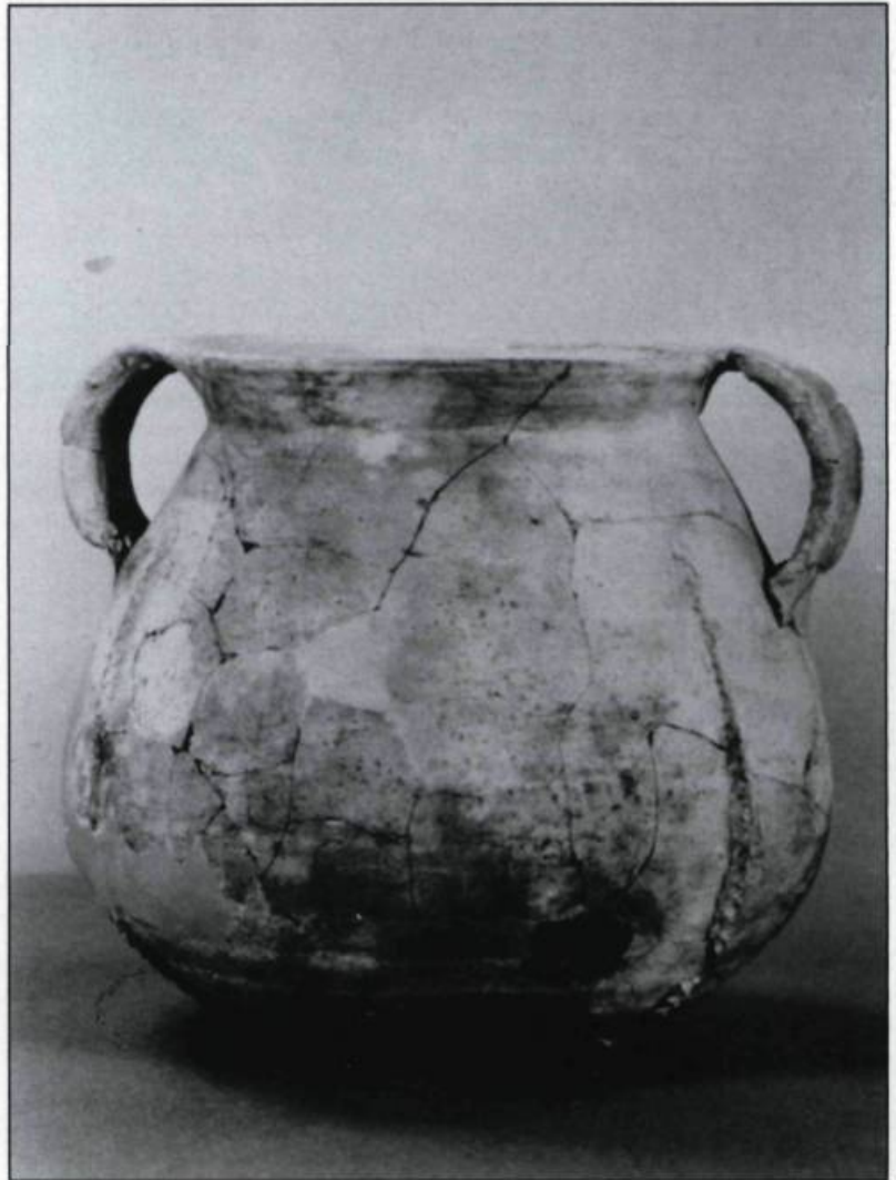
En retrait du four, une aire d'habitation est révélée par la présence de tessons de céramique européenne provenant principalement d'une petite marmite bulbeuse à pâte chamoise roussâtre, décorée de bandes verticales moletées de motifs géométriques, identique à celle-ci trouvée à Red Bay.

Bordeaux font référence à ces grandes chaudières fabriquées avec du cuivre importé d'Allemagne ou de Suède. Il y avait vraisemblablement une plate-forme érigée à l'arrière du four comme c'est souvent le cas sur les sites basques de Red Bay. Cette plate-forme aurait facilité l'accès à la