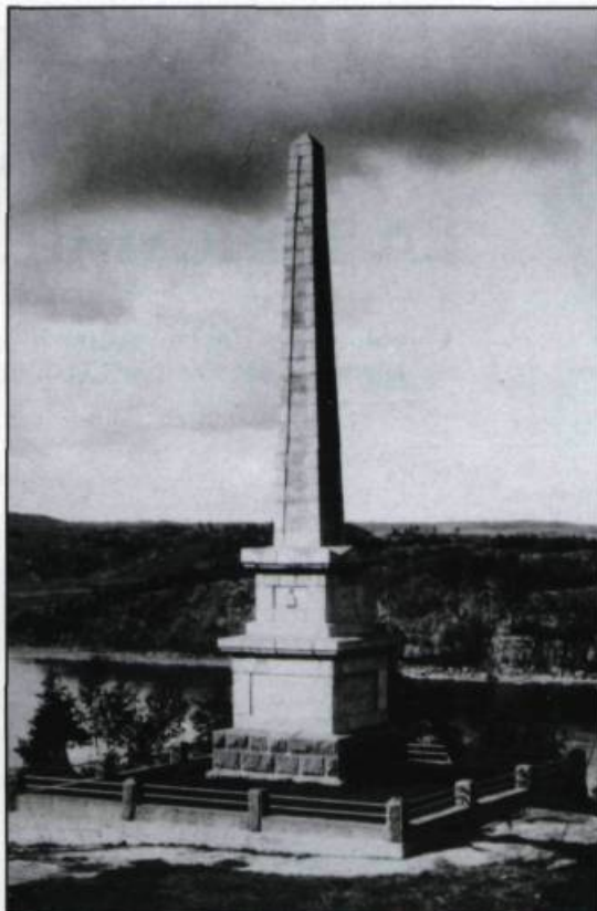
Monument en l'honneur de William Price, un des pionniers de Chicoutimi.

Après sa mort, les habitants de Chicoutimi resteront marqués longtemps par le régime des fiers-