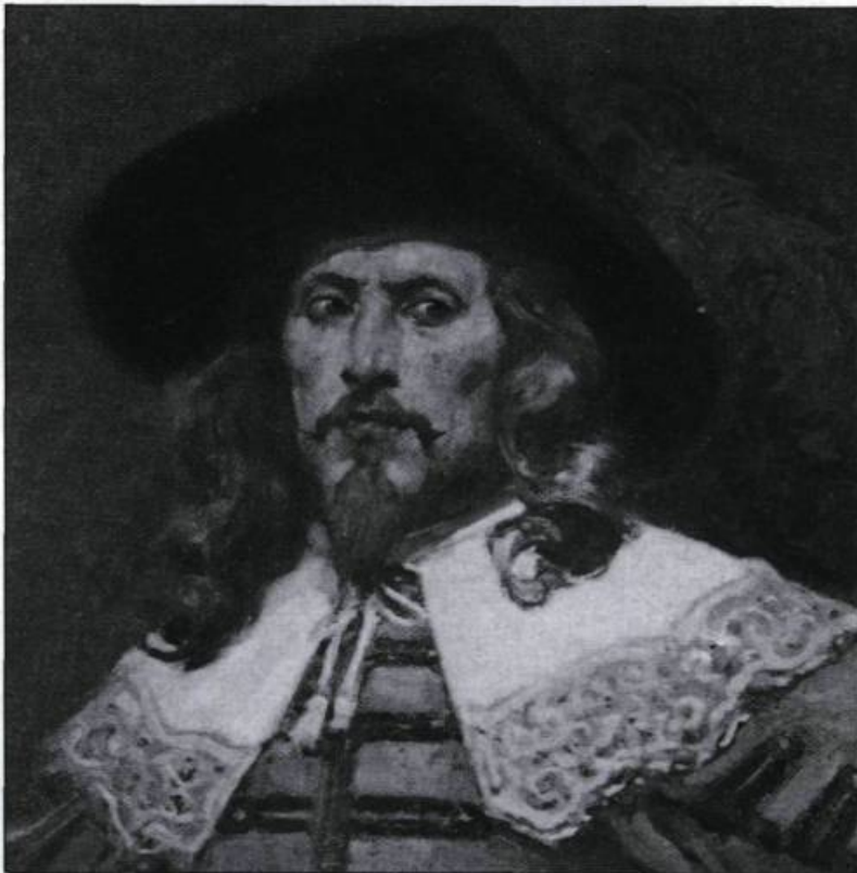
Paul de Chomedey, sieur de Maisonneuve (Nouvelle-sur-Vanne en Champagne, 1612-Paris 1676). Illustration de Marc-Aurèle De Foy Suzor-Côté. (Héroïsmes d'antan-Victoires d'aujourd'hui, 1923).

À cause de l'arrivée tardive d'un des trois navires qui amènent au Canada la recrue, l'entreprise choisit d'hiverner à Sillery dans des maisons