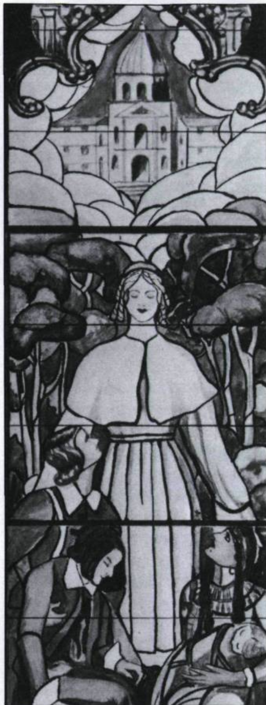
Ce vitrail de la basilique Notre-Dame de Montréal rend hommage à Jeanne Mance (1606-1673), fondatrice de l'Hôtel-Dieu de Montréal et collaboratrice importante de Maisonneuve. (Nos Racines, p. 328).

L'aide de Jeanne Mance rend possible le recrutement d'une centaine de nouveaux colons en 1653, permettant ainsi à la petite colonie de l'île de Montréal de recevoir l'appui nécessaire pour résister aux attaques ennemies.