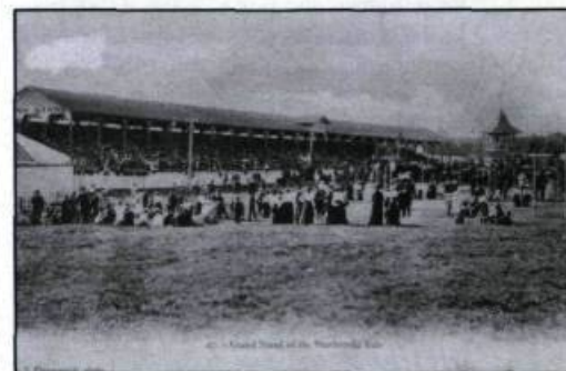
«47. – Grand Stand of the Sherbrooke Fair». Scène d'une exposition agricole à Sherbrooke avant 1910. (Carte postale d'Alfred-Zénon Pinsonneault; coll. de l'auteur).

tion et la célébration du 500 e anniversaire de l'arrivée de Christophe Colomb en Amérique, du 350 e anniversaire de la fondation de Montréal et de Sorel, du 325 e anniversaire de la fondation de Boucherville, du 125 e anniversaire de la Confédération canadienne et de sûrement quelques autres anniversaires que nous oublions. Cette éventuelle moisson nous fait déjà jubiler! ♦