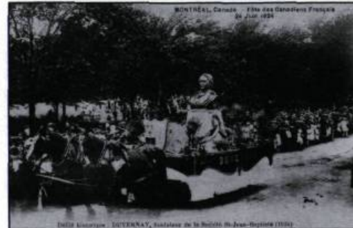
«Montréal, Canada – Fête des Canadiens Français 24 juin 1924. Défilé historique: Duvernay, fondateur de la Société Saint-Jean-Baptiste (1834)». (Carte postale; coll. de l'auteur).

Diamants , d'au moins quelques cartes postales illustrant le mémorable défilé montréalais de 1990 de la fête nationale des Québécois ne serait-elle pas à souhaiter? Quelles belles cartes patriotiques les collectionneurs pourraient alors ajouter à leur collection! Et nous souhaitons aussi une manne de belles cartes postales en 1992 pour la commémora-