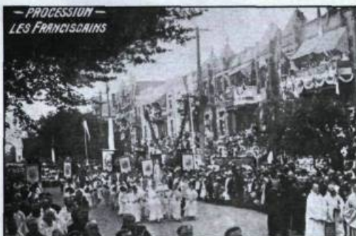
Procession lors du Congrès eucharistique de Montréal en 1910. (Carte postale éditée par Illustrated Post Card Co.; coll. de l'auteur).

internationales qui ont suivi, tant aux États-Unis qu'en Europe, présentent des «dessins d'événements», œuvres d'aquarellistes ou de «typographes» comme on les appelait à l'époque.