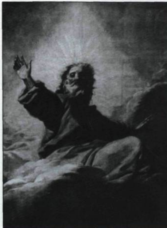
«Le Père éternel». Mar- guerite d'Youville commande elle-même ce tableau à Paris et le reçoit en 1741. Sauvé d'un incendie en 1765, il est conservé aujourd'hui à la maison mère des sœurs Grises à Montréal.

Revenue au foyer de Varennes, la jeune fille se distingue par l'ardeur qu'elle apporte au travail car, dit son fils, elle s'efforce de gagner de quoi faire subsister ses frères et sœurs. Heureuse- ment pour le budget familial, les travaux de cou- ture et surtout de broderie abondent, car l'on brode tout, depuis les souliers jusqu'aux ves-