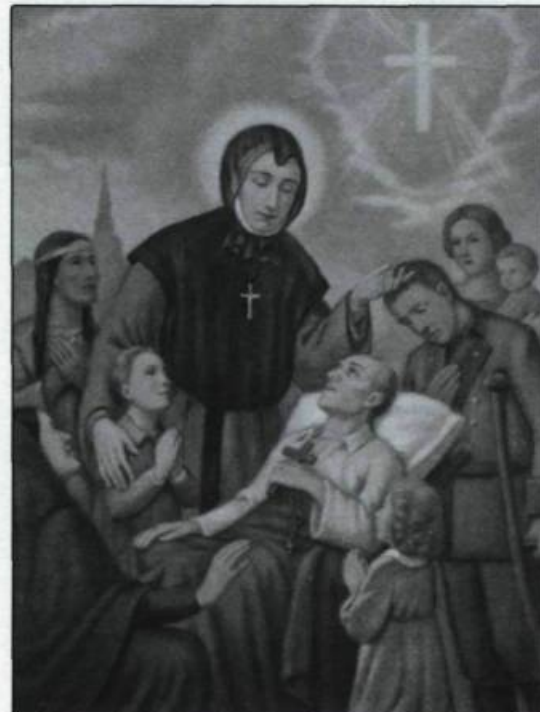
Cette œuvre d'un artiste italien illustre les diffé- rentes œuvres créées par madame d'Youville.

Il n'est pas étonnant que mademoiselle de La- jemmerais, malgré sa pauvreté, soit courtisée par un certain jeune homme de la haute so- ciété... Mais voilà que madame de Lajemmerais convole en secondes noces avec un personnage