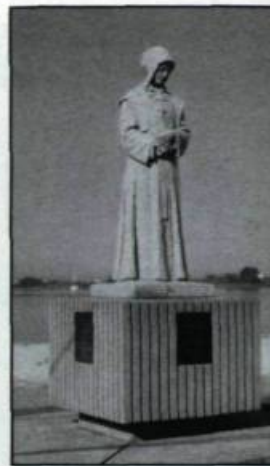
Monument de sainte Marguerite d'Youville sur les bords du grand fleuve Saint-Laurent. Il perpétue son souvenir à Varennes. (Carte postale. Archives des sœurs de la Charité, Montréal).

Sous le soleil de minuit, au pays des neiges, tout comme sous le soleil tropical de l'Afrique, on s'efforce d'imiter cette femme «qui a beaucoup aimé Jésus-Christ et les pauvres», se méritant ainsi le beau titre de Mère à la charité universelle. ♦