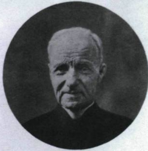
Fr. André c.s.c. L'apôtre de saint Joseph

La réputation de thaumaturge (guérisseur) du frère André amène des centaines de fidèles de toutes provenances à vouloir rencontrer l'humble portier pour recevoir de l'aide.