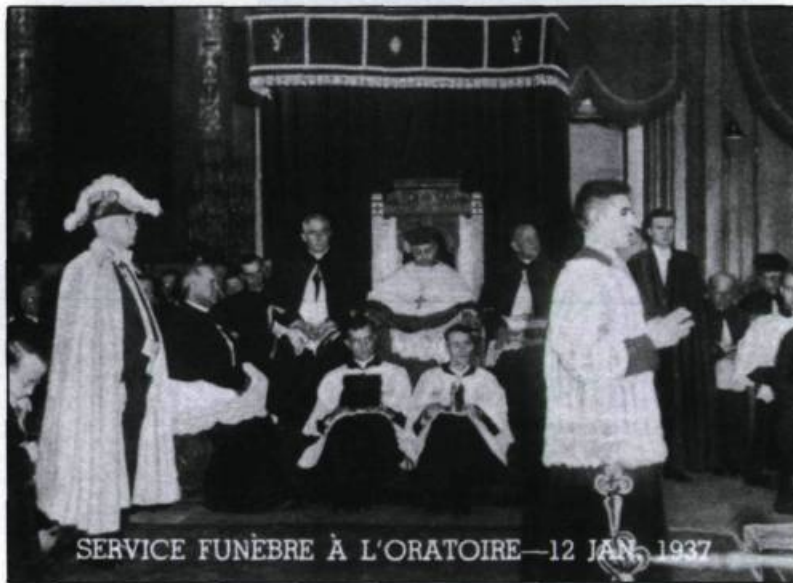
SERVICE FUNÈBRE À L'ORATOIRE—12 JAN. 1937

La réputation de thaumaturge (guérisseur) du frère André amène des centaines de fidèles de toutes provenances à vouloir rencontrer l'humble portier pour recevoir de l'aide.