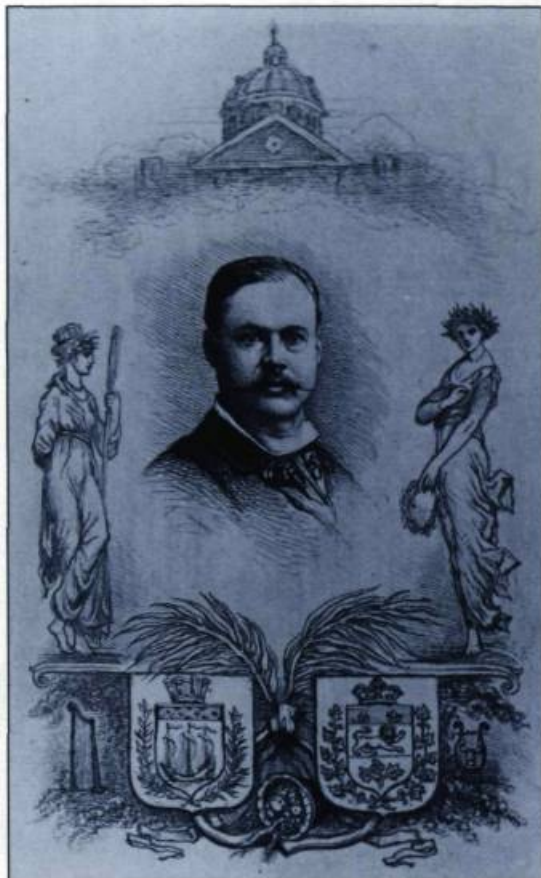
Louis-Honoré Fréchette (1839-1908). Homme marquant des lettres québécoises, il connaît une carrière mouvementée partagée entre le droit, le journalisme, la fonction publique et la politique. En 1880, l'Académie française reconnaît son talent en lui décernant le prix Montzon.

Sur le plan littéraire, les contes de Fréchette font bonne figure dans le panorama du XIX e siècle, quoique l'on puisse déplorer la qualité inégale de certains textes. Trop fréquemment Fréchette