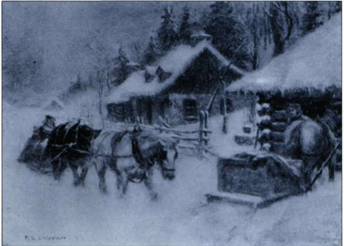
«Tempête d'hiver». Œuvre de Frederick Simpson Coburn illustrant l'un des contes de La Noël au Canada .