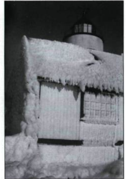
Images du phare de l'île Verte au cours de l'hiver 1963.