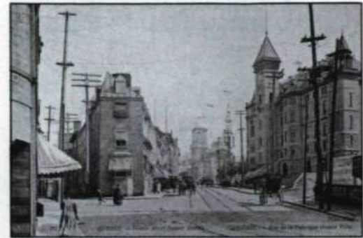
Un avant-goût des célèbres cartes postales du photographe Neurdein (N D phot.) qui seront présentées au Centre Vivre à Québec en 1990.

Présentée en collaboration avec la revue Cap-aux-Diamants , cette exposition mettra en valeur les œuvres photographiques (cartes postales) produites sur la ville de Québec par le photographe Neurdein de Paris, en 1907. Près de 80 œuvres ont été