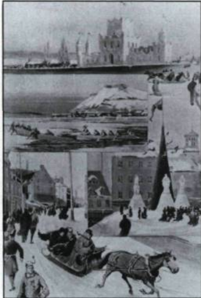
Scènes pittoresques du carnaval d'hiver de Québec en 1894 par l'artiste William H. Lawrence.

Du 21 janvier 1990 au 4 mars 1990. « D'un carnaval à l'autre »