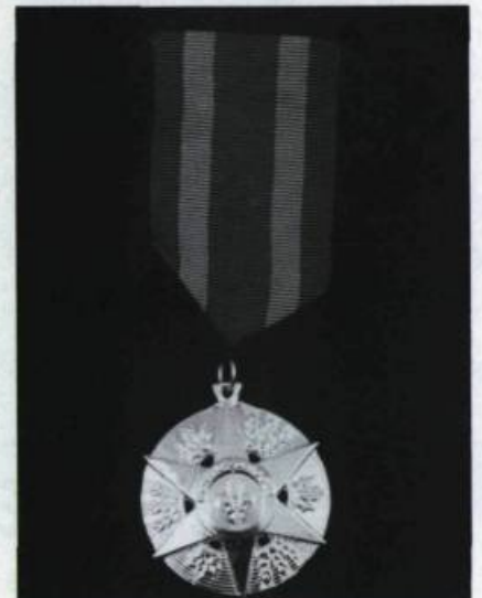
La médaille d'or de l'Ordre du mérite agricole remise en 1889.