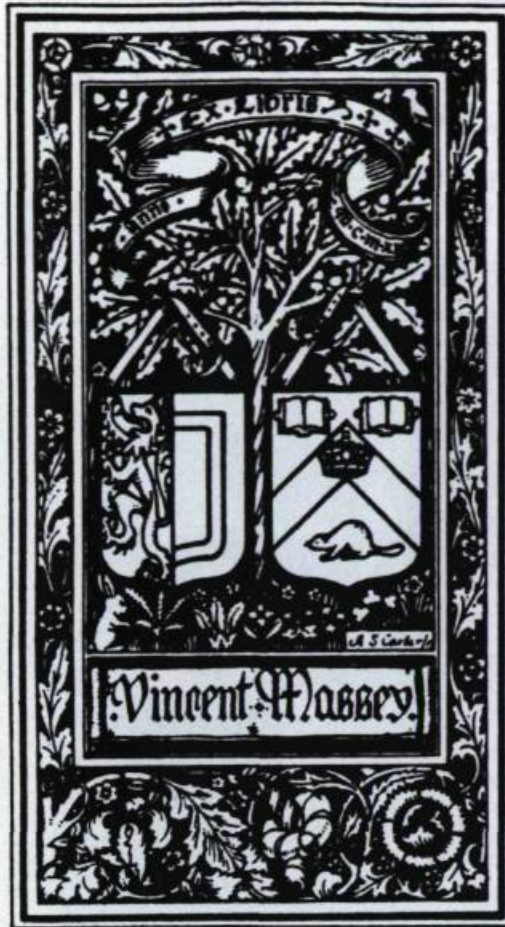
Vincent Massey a été le premier Canadien à occuper la fonction vice-royale. En plus de son ex-libris personnel, sa famille possédait le sien.

D'autres éminents citoyens de Québec possèdent des armoiries concédées par les rois de France ou d'Angleterre. Sir Wilfrid Laurier, député de Québec-Est et premier ministre du Canada, a porté des armoiries dont on attribue le dessin à l'architecte Eugène-Étienne Taché. Louis-Hippolyte Lafontaine reçut les siennes de la reine Victoria. Les boiseries du parlement de Québec, en particulier celles de l'escalier principal, montrent les armoiries de nombreux compatriotes et concitoyens et celles de personnages importants de notre histoire. Ces armoi-