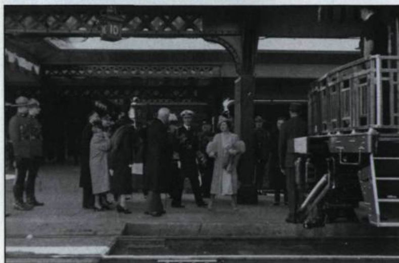
Le départ du couple royal de la gare Union de Québec après un bref séjour dans la vieille capitale.