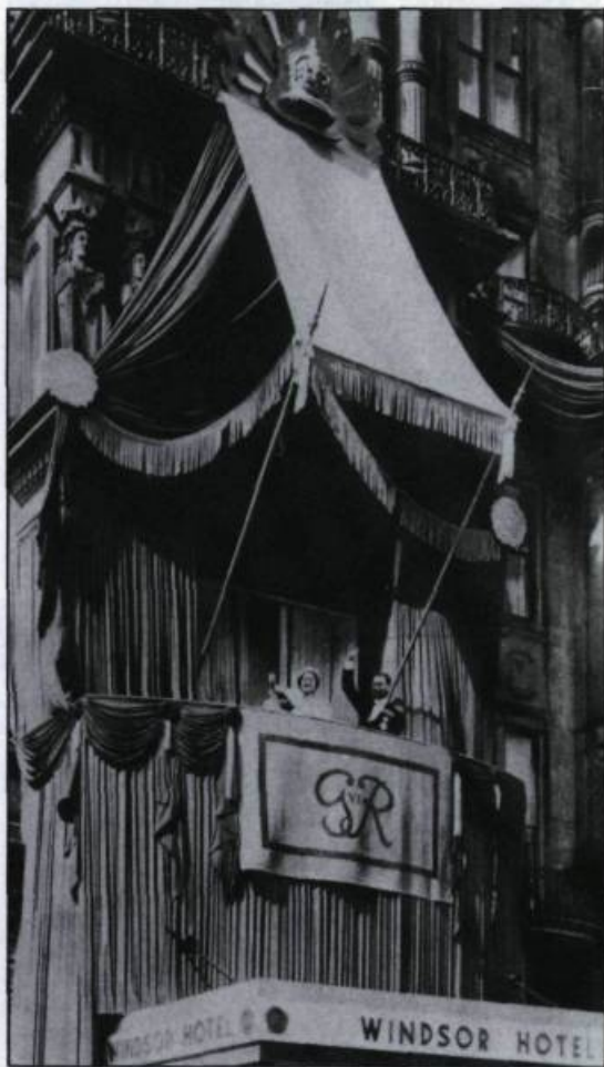
George VI et Elizabeth saluent la foule du balcon de l'hôtel Windsor à Montréal le 18 mai 1939. (Collection Yves Beau-regard).

Sur les voies du Canadien Pacifique, c'est la célèbre locomotive 2850 aux armes du roi qui