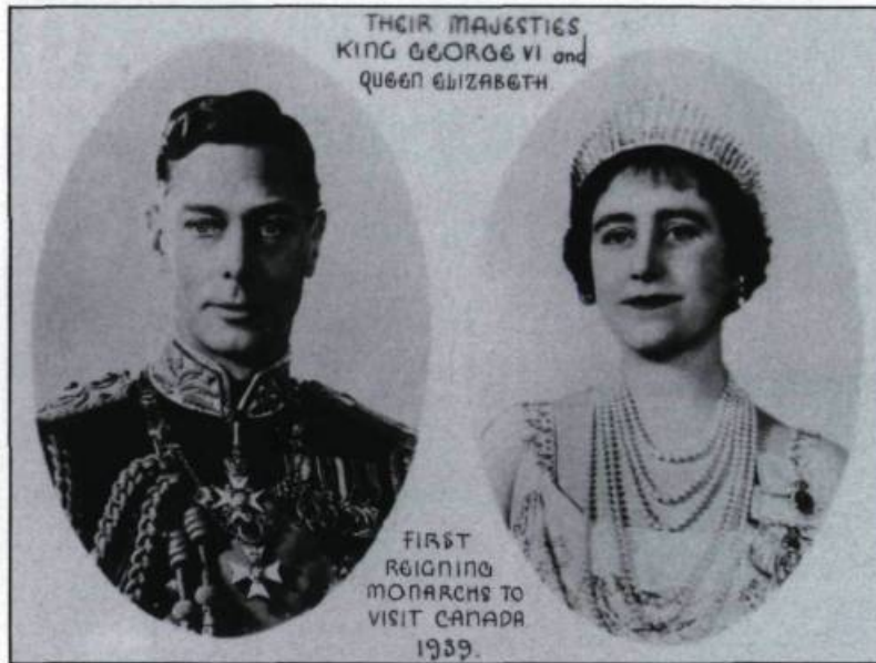
Lors du séjour au Canada de George VI et de la reine Elizabeth, en mai 1939, c'est la première fois que des monarques en titre effectuent une telle visite.