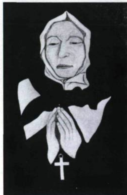
Portrait véritable de Marguerite Bourgeoys par Pierre Le Ber en 1700.

Voilà une histoire à découvrir. Aujourd'hui la ferme a cessé ses activités, mais le visiteur peut toujours y revivre le passé. Après l'ère