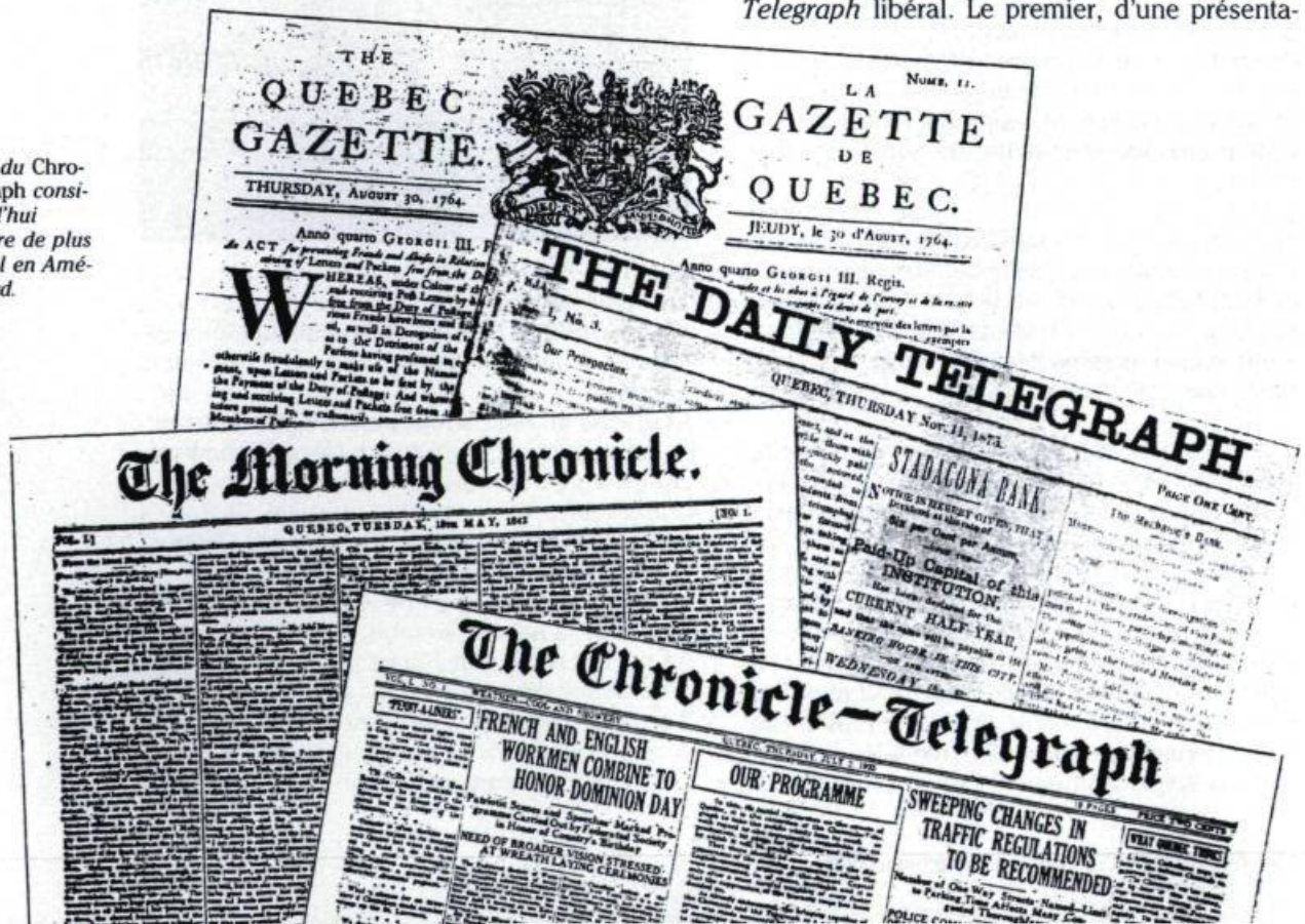
Les ancêtres du Chronicle-Telegraph considéré aujourd'hui comme le titre de plus vieux journal en Amérique du Nord.

Aux yeux de plusieurs citoyens, l'union des deux journaux anglophones apparaît contre nature. Le Morning Chronicle est conservateur, le Daily Telegraph libéral. Le premier, d'une présenta-