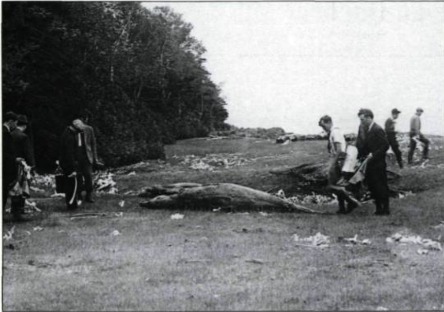
La chasse aux mammifères marins décime les troupes de cétacés du fleuve Saint-Laurent. En octobre 1934, Paul Carpentier photographie des carcasses de marsouins. (Archives nationales du Québec à Québec, fonds Office du film).

La Linnéenne, c'est aussi, depuis dix ans, le pionnier des croisières d'observation de baleines. Elle gère un navire amarré à la marina de Rivière-du-Loup. À bord du Samuel de Champlain, 80 passagers ont ainsi la possibilité d'aller contempler le paysage marin et la faune qui l'habite. Des excursions pour observer des oiseaux marins figurent également au programme.