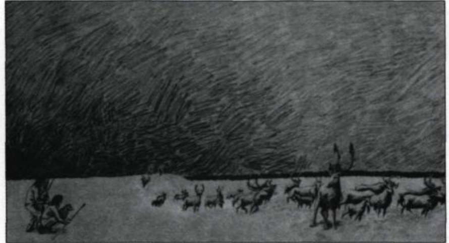
Cette illustration de Claire Fournier montre des chasseurs et un troupeau de caribous. (Villa Bagatelle).

Il y a 35 000 ans des humains d'origine asiatique traversent sur le territoire américain.