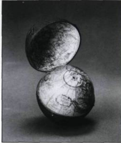
Petit globe en bois, laiton et papier portant une planisphère céleste dans la doublure de la boîte. C. Price, Londres, Angleterre, vers 1755. (Musée David M. Stewart).

Du 8 mai au 9 septembre 1990. « Planètes, Potions et Parchemins » « Scientifica Hebraïca, des manuscrits de la mer Morte au XVIII e siècle »