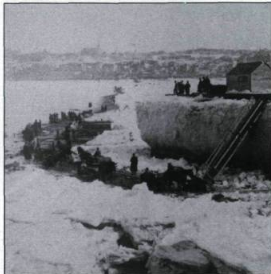
Séréogrammes de Shrohmeyer and Wyman et de Underwood et Underwood montrant le pont de glace entre Québec et Lévis vers 1892. À noter l'importance de l'achalandage. (Collection Yves Beau-regard).

Entre Trois-Rivières et Québec, les conditions de prise du Saint-Laurent sont moins favorables mais il existe néanmoins quelques ponts de glace, dont celui reliant Sainte-Croix et Les Écu-reuils. À la hauteur de Québec, la formation d'un pont de glace constitue un véritable événement: dans la première moitié du XIX e siècle, il n'apparaît que onze fois. Occasionnellement un pont se forme entre l'île d'Orléans et la Côte-de-Beaupré, mais jamais à l'île aux Coudres. Là, il faut recourir au canot à glace pour traverser au milieu des glaces flottantes, moyen de transport grâce auquel on dessert les nombreuses îles du Bas-Saint-Laurent.