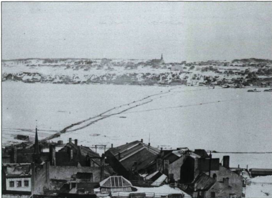
St. Lawrence Ice Bridge and Town of Lévis.

même que des volailles. Les victuailles arrivent alors en une telle abondance que les consommateurs bénéficient ordinairement d'une diminution des prix. Cette économie est due à l'utilisation gratuite du pont de glace, alors que la traverse estivale nécessite un déboursé de la part des agriculteurs. En plus de permettre un meilleur approvisionnement, les ponts de glace facilitent le transport des marchandises lourdes telles que le bois de chauffage et la pierre.