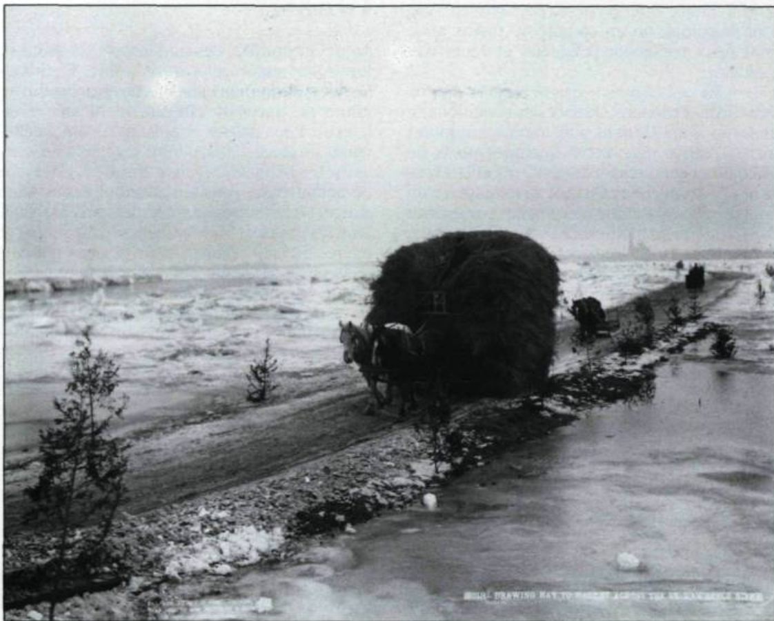
Drawing Hay to Market across the St. Lawrence River. Cette photographie de William Notman and Son montre le pont de glace entre Longueuil et Montréal vers 1903. (Musée McCord, collection Notman).