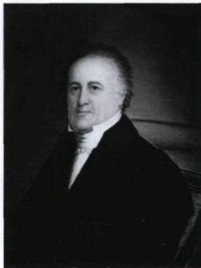
Anonyme, Stephen Burroughs, 1810-1820.

Le deuxième portrait concerne un personnage aussi notoire, mais d'une toute autre façon. Stephen Burroughs (1766-1840) connaît une vie fort mouvementée, relatée en partie dans son autobiographie publiée pour la première fois en 1798 et rééditée à neuf reprises au moins. Né au Connecti-