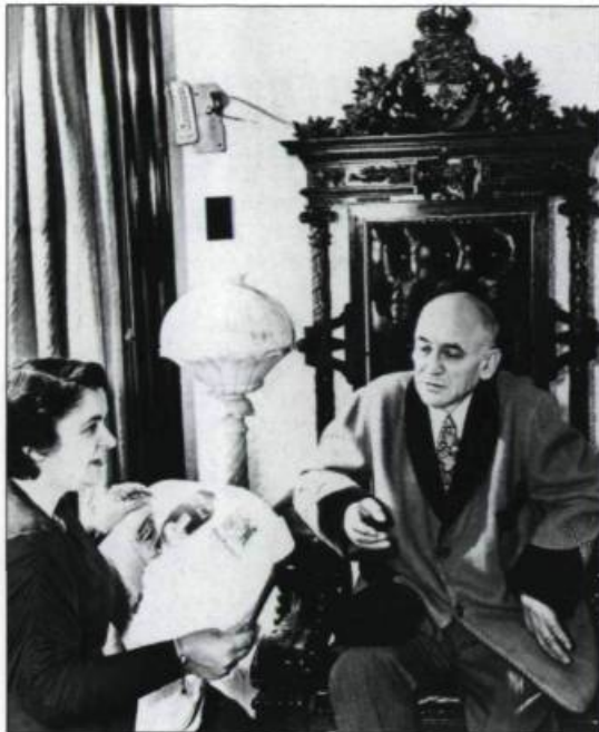
Télesphore-Damien Bouchard (1881-1962). Journaliste et homme politique, il occupe en 1939 les poste de ministre de Travaux publics et de la Voirie et va jouer un rôle stratégique dans la négociation entre Godbout et le cardinal Rodrigue Villeneuve.

Théâtrale à souhait, cette thèse fait de Godbout un faible et du père Lévesque un thaumaturge. De même, en attribuant à de bons conseils la fermeté finale du premier ministre, cette thèse laisse dans l'ombre l'engagement contenu dans le programme électoral de Godbout. L'autre version s'inscrit dans une plus longue durée. Rumilly écrit en effet: «...Madame Casgrain et Idola Saint-Jean mènent la lutte depuis vingt ans. Elles consentent à leur cause un suprême sacrifice en avouant cette ancienneté. Toutes deux sont très douées. Madame Casgrain dispose d'influences politiques, au point qu'on la croit candidate au Sénat. Elle a converti ou contribué à convertir le premier ministre Godbout. Elle le pousse à franchir le dernier obstacle, qui n'est pas le moindre, puisque le cardinal l'a dressé.»