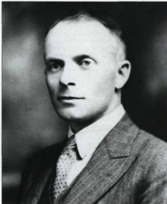
Adélard Godbout (1892-1956), agronome, professeur, et homme politique. Premier ministre de la province de Québec de 1939 à 1944, il présente lui même le «bill» accordant aux femmes le double droit de vote et d'éligibilité.

Adélard Godbout, qui a toujours voté contre le suffrage féminin, présente lui-même, en soutenant que les temps sont changés, le bill accordant aux femmes le double droit de vote et d'éligibilité.