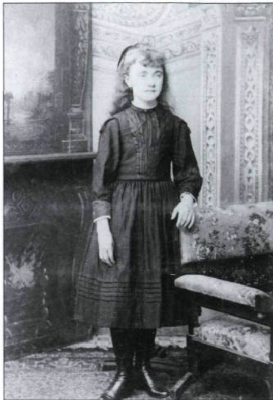
Une couventine en 1855. Au XIX e siècle, plus de femmes sont alphabétisées que les hommes, mais l'instruction secondaire profite exclusivement à ces derniers.