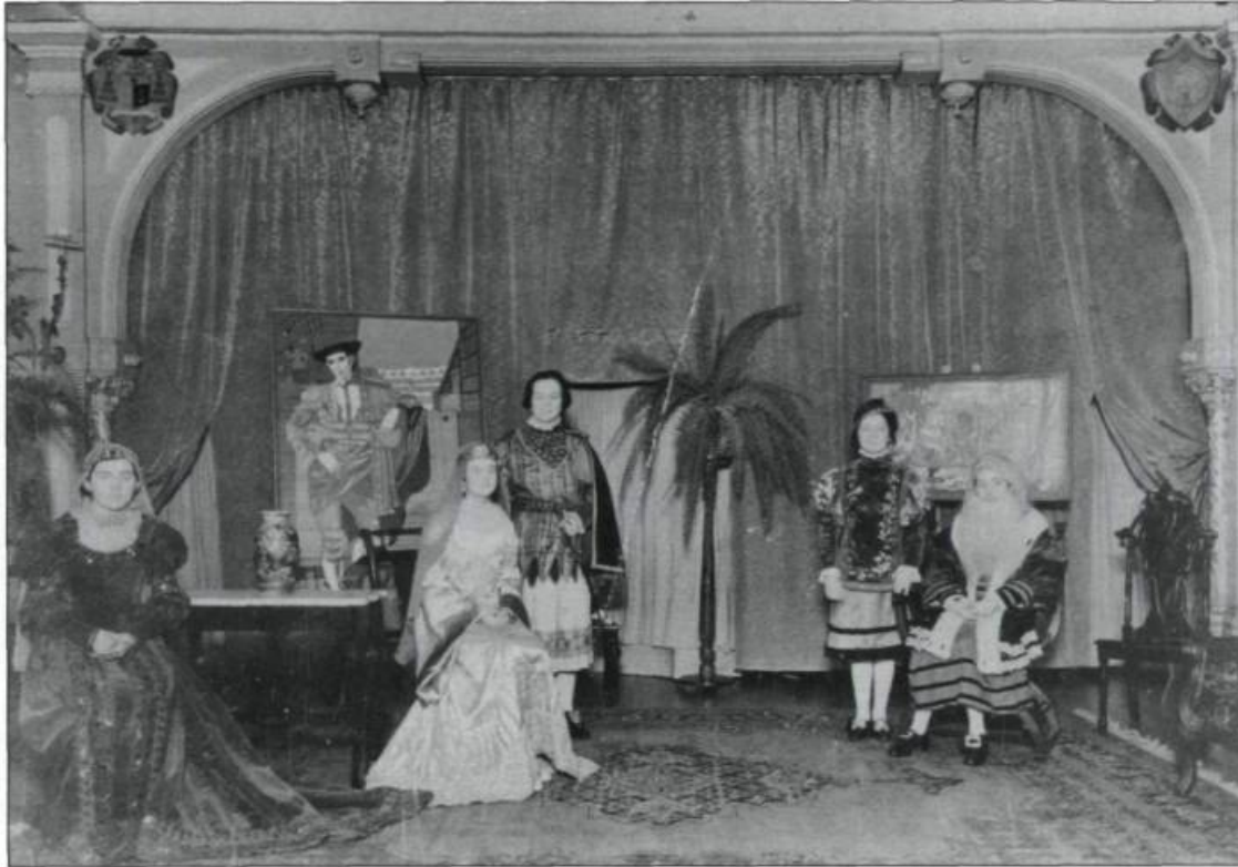
Représentation du Cid de Corneille au Mont Sainte-Marie en 1937. (Collection privée).

minine. Pendant qu'un discours conservateur continue à valoriser un enseignement limité pour les filles et à condamner le travail salarié pour les femmes, plusieurs d'entre elles se servent de leur instruction pour modifier leur rôle dans la société. Un nombre grandissant d'entre elles optent pour le travail après leurs études.