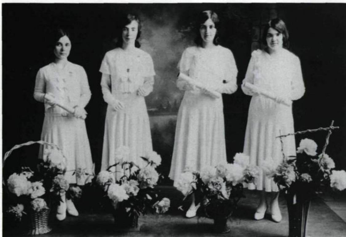
Un nombre grandissant d'étudiantes diplômées des pensionnats se servent de leur instruction pour modifier le rôle de la femme dans la société. (Archives du Pensionnat de Coaticook).