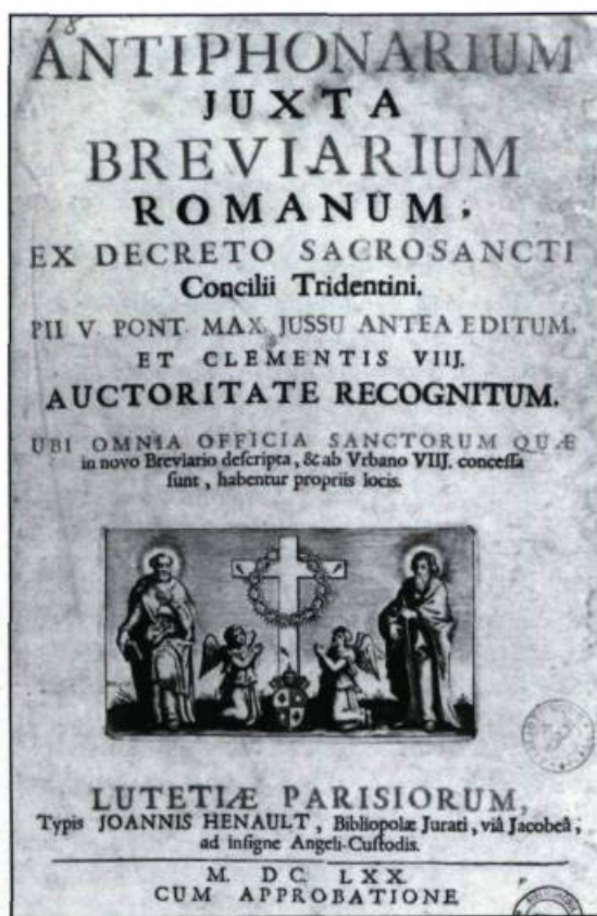
Antiphonarium (1670). (Archives et livres rares, université Laval).

Après l'incendie du premier monastère, le 30 décembre 1650, les Ursulines reprennent cou-