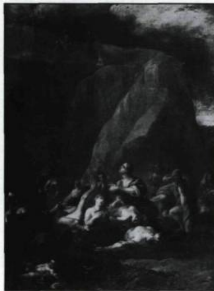
« The Brazen Serpent », Anonyme.