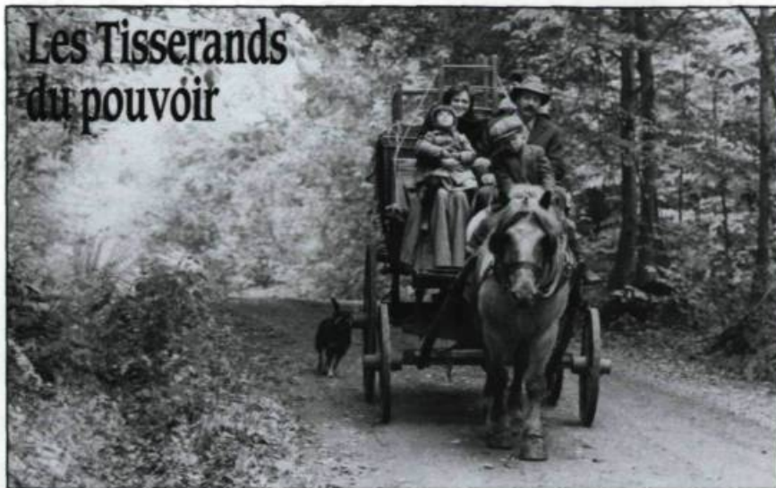
Départ de la famille Lambert pour la Nouvelle-Angleterre. (Tiré du film: Les Tisserands du pouvoir ).

Tous les films récupérés par cette entreprise à but non lucratif sont copiés sur vidéocassette puis prêtés aux amateurs. Une voûte protège les originaux. (Sources: New York Times , 4 septembre 1988). ♦