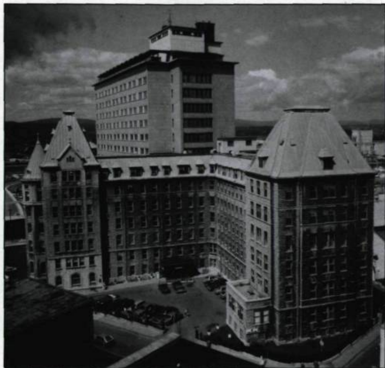
L'hôpital Hôtel-Dieu de Québec aujourd'hui. (Archives du Monastère de L'Hôtel-Dieu de Québec).

En 1931, la restauration complète du bâtiment et l'ajout du pavillon Richelieu et de l'aile du Précieux-Sang permettent de porter le nombre de lits à 375. Par la suite, l'ensemble architectural subit une seule transformation majeure, soit l'addition d'une tour de 14 étages qui remplace, à la fin des années 1950, l'ancien pavillon d'Aiguillon.