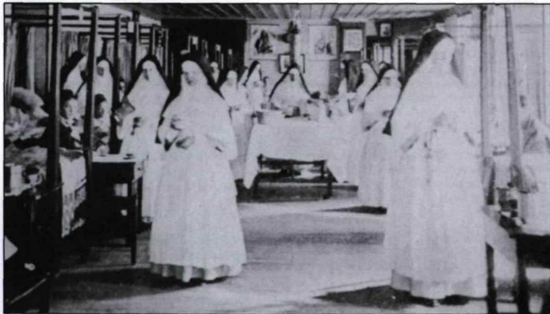
Chambre de malade à L'Hôtel-Dieu de Québec à la fin du XIX e siècle.

Les guerres iroquoises déciment les populations amérindiennes qui fréquentent l'hôpital. Par contre l'arrivée du régiment de Carignan et de