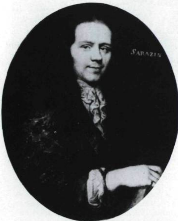
Le docteur Michel Sarazin (1659-1734), figure célèbre de l'histoire médicale canadienne, pratiqua à L'Hôtel-Dieu de Québec.

nombreux que les médecins. Les services de chirurgien, souvent peu qualifié, sont moins coûteux et plus utiles que ceux du médecin qui sait dissenter et prescrire, mais ne pratique ni saignée, ni clystère.