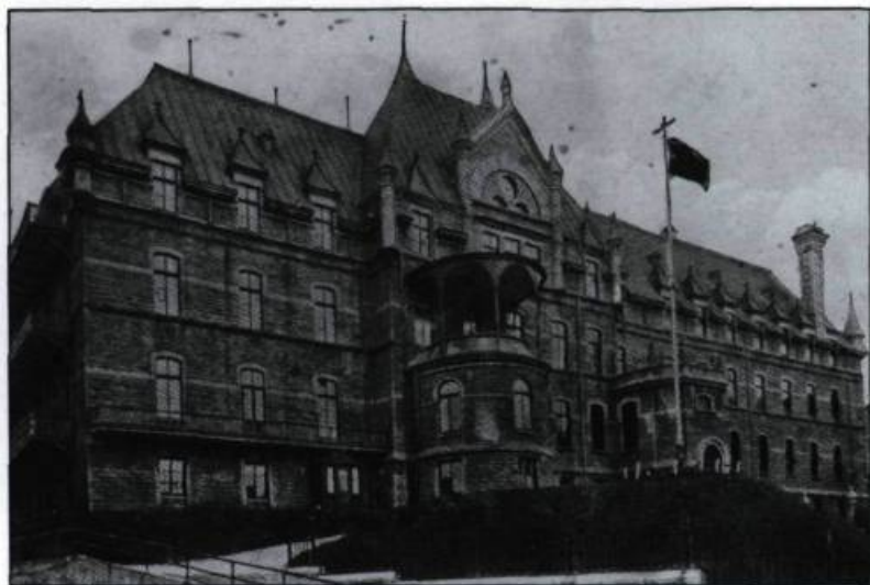
Le pavillon d'Aiguillon vu de la côte du Palais vers 1920. Cet édifice sera rasé en 1959 pour faire place à des bâtiments plus adéquats.