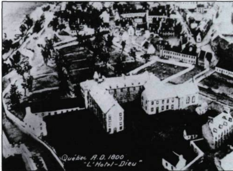
L'Hôtel-Dieu tel qu'il apparaît sur la maquette Duberger (ca 1805).

enfants, les femmes enceintes, quelques lépreux et les cas de maladies vénériennes qui relèvent du gouvernement sont dirigés vers L'Hôpital général. Les autres victimes de maladie infectieuse sont traités à L'Hôtel-Dieu. Les nombreuses épidémies de variole, de fièvre pourpre, de rougeole, de typhus et de peste qui sévissent en Nouvelle-France engorgeaient L'Hôtel-Dieu qui doit à cette occasion faire construire des abris temporaires pour accommoder tous les malades.