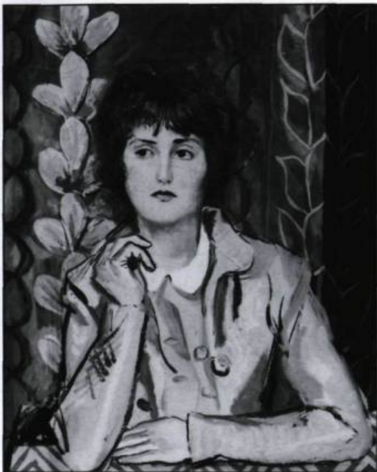
«Jeune fille au col blanc». Huile sur toile vers 1933. (Photo: Patrick Altman, Musée du Québec).

Merveilleusement doué, Pellan assimile rapidement les leçons de ses maîtres et accumule les succès pendant ses années d'apprentissage; au terme de ses études, il rafle les premiers prix dans toutes les matières. Et pour tout couronner, il se voit attribuer en 1926 l'une des premières bourses du gouvernement québécois pour aller compléter sa formation à Paris.