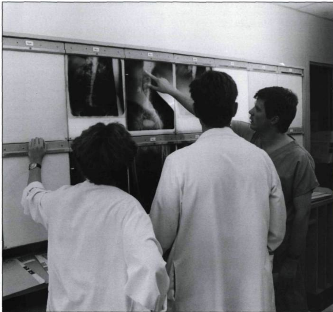
L'enseignement de la médecine représente l'une des grandes missions de l'Hôtel-Dieu de Québec. (Photographie médicale, Hôtel-Dieu de Québec).