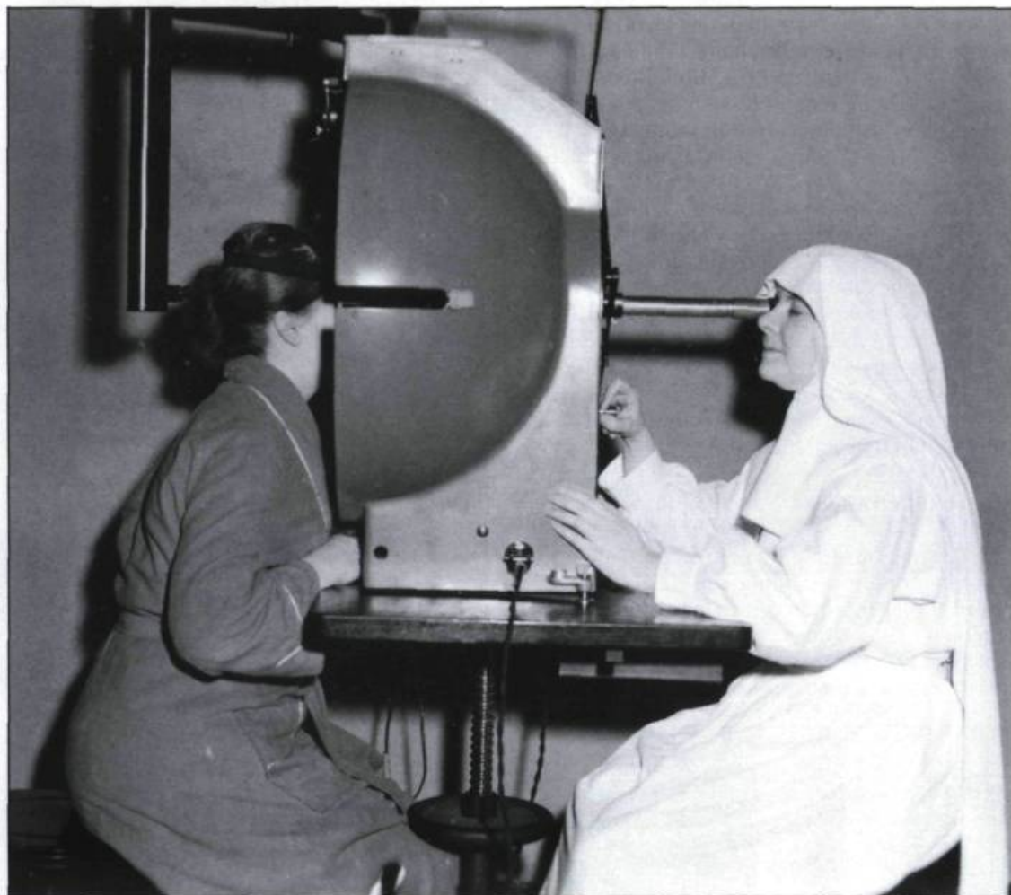
Les hospitalières n'hésitent pas à se perfectionner face au développement rapide des différentes spécialités. (Photographie médicale, Hôtel-Dieu de Québec).

En 1943, l'université acquiesce à la demande des religieuses de l'Hôtel-Dieu désirant se spécialiser davantage et établit une École supérieure en Sciences hospitalières. La première année du cours conduit au certificat et la seconde au baccalauréat.