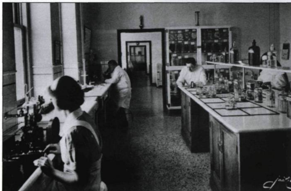
La formation pédagogique destinée aux futures religieuses-infirmières leur permet de travailler dans différents secteurs, comme la recherche en laboratoire. (Photo Jackie, carte postale, Collection Yves Beauregard).