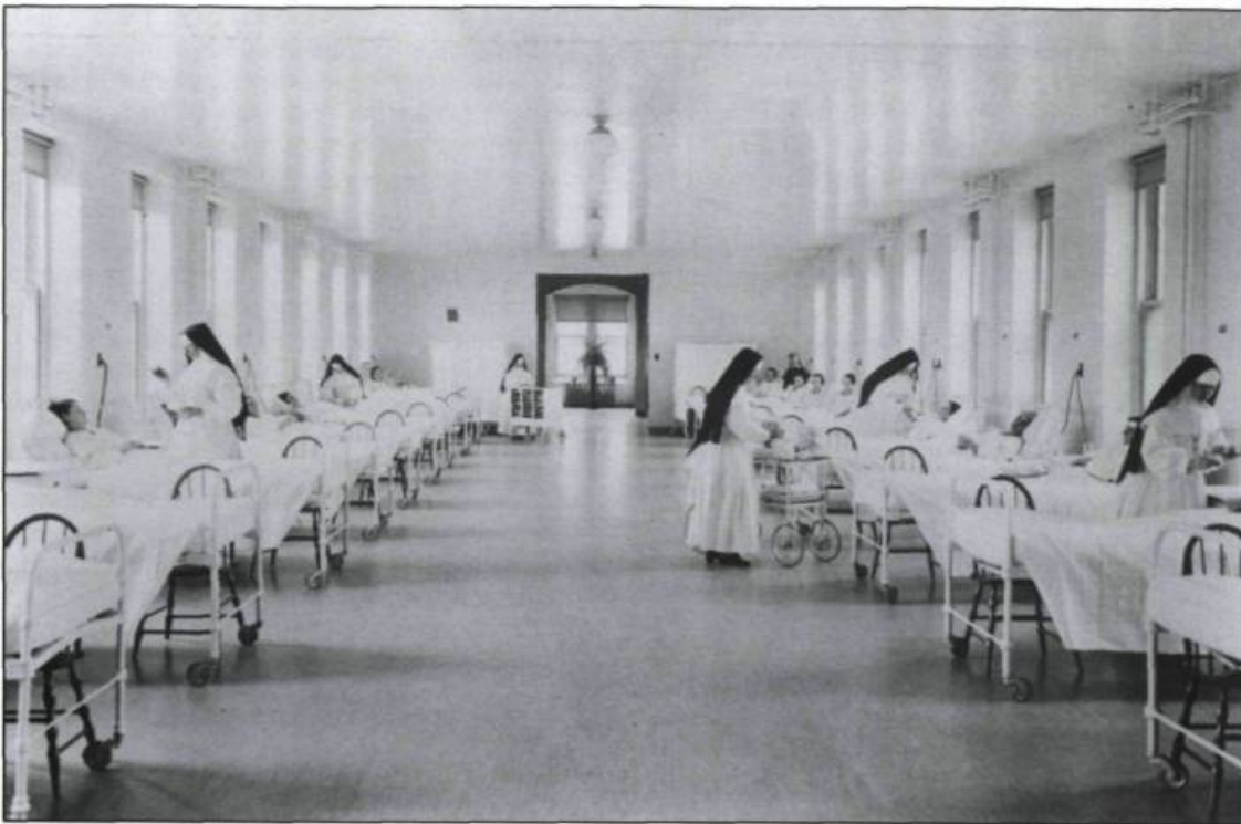
La distribution des médicaments en 1954. (Archives du Monastère de l'Hôtel-Dieu de Québec).