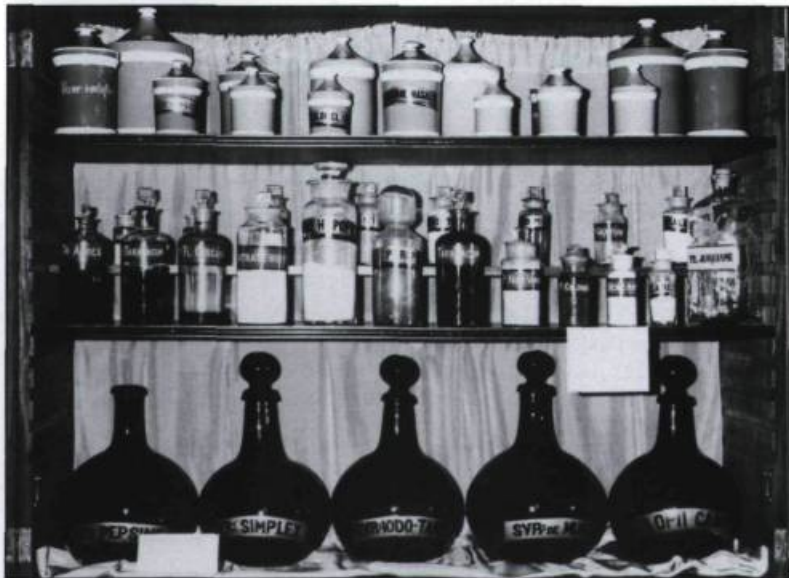
Armoire de pharmacie datant de la fin du XVIII e siècle. Don des jésuites aux Augustines de l'Hôtel-Dieu de Québec en 1800. (Musée des Augustines, Photographie médicale, Hôtel-Dieu de Québec.)

Le capillaire, plante médicinale locale, guérit les affections de la poitrine: on en prépare un sirop ou un thé pour guérir les rhumes et les maladies pulmonaires. On attribue au capillaire des propriétés stomachiques. Il sert aussi d'apéritif.