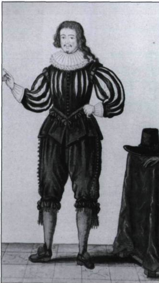
Costume de chirurgien français au XVII e siècle. (Bibliothèque nationale, Estampes, Paris).