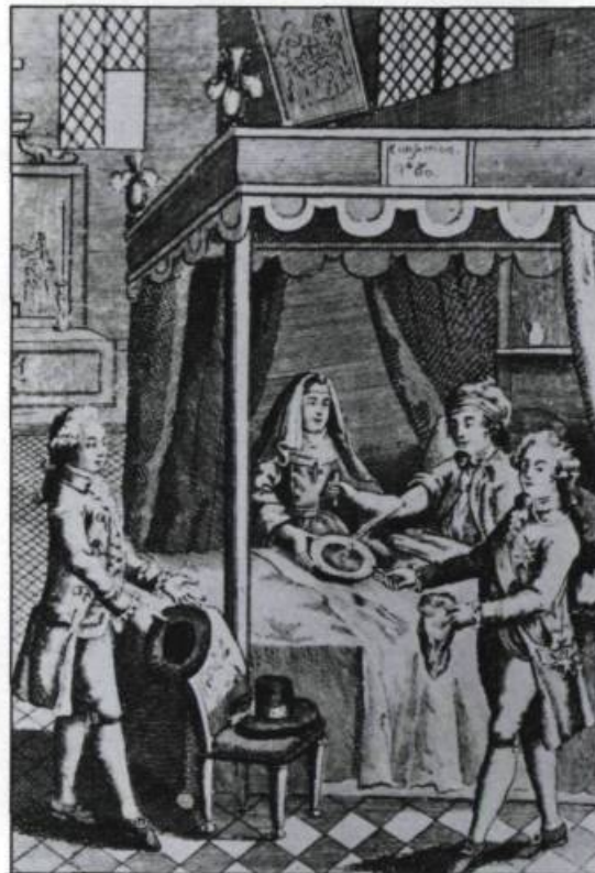
L'utilisation abusive de la saignée fait naître une controverse autour de ce traitement. (Histoire des hôpitaux en France, p. 268).

Pour soigner les maladies, les médecins des XVII e et XVIII e siècles recourent aux méthodes classiques, utilisées depuis l'Antiquité. Ces méthodes favorisent principalement quatre formes de thérapeutiques: la saignée, les lavements, la sudation et la diète.