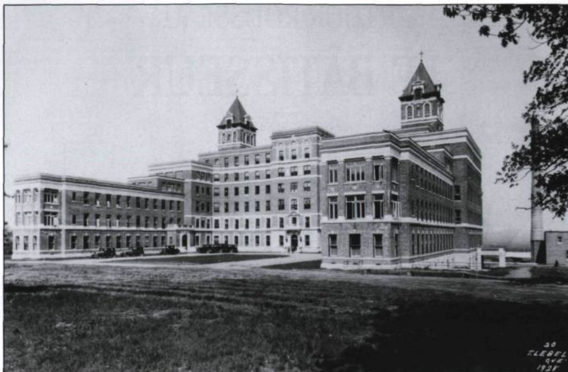
La faculté de médecine de l'université Laval construite en 1854 d'après les plans des architectes Browne et Le-court.