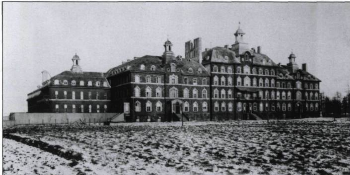
L'Hôtel-Dieu du Sacré-Cœur se consacre tout d'abord à soigner les enfants.

De graves problèmes financiers marquent l'histoire de cette première décennie. En 1895, la communauté des Augustines de Chicoutimi se détache de l'Hôpital Général puis, appuyée par l'évêché de Chicoutimi, se porte acquéreur de l'Hôtel-Dieu Saint-Vallier, jusque-là propriété du gouvernement.