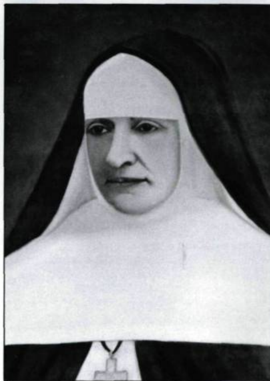
Portrait de mère Sainte-Thérèse de Jésus, fondatrice de l'Hôtel-Dieu de Lévis en 1892.