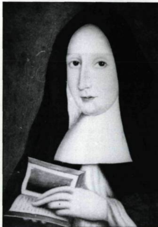
Portrait de mère Louise Soumande de Saint-Augustin, première supérieure de l'Hôpital Général de Québec de 1693 à 1708. (Archives du Monastère de l'Hôtel-Dieu de Québec).

Pendant quelques années, l'institution dépend de l'Hôtel-Dieu de Québec, dont elle est une simple «succursale». En 1701 cependant, l'Hôpital Général de Québec se détache de la maison-mère et les Augustines qui y œuvrent forment une nouvelle communauté, distincte de la précédente.