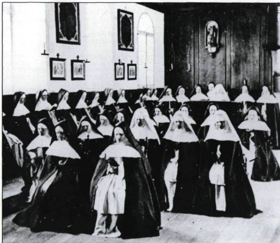
Prière dans la chapelle intérieure. (Ville de Québec, Division du Vieux-Québec).