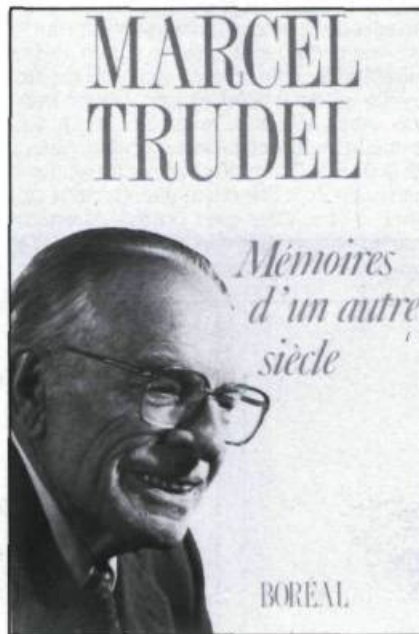
Trudel, Marcel. Mémoires d'un autre siècle. Montréal, Boréal, 1987. 313p.

Mémoires d'un autre siècle : un grand livre et une remarquable leçon d'histoire. L'autobiographie de Marcel Trudel constitue en effet un impressionnant document sur le XXI ème siècle québécois, celui de la Révolution tranquille et d'avant, et une démonstration sereine et magistrale de la pratique du métier d'historien.