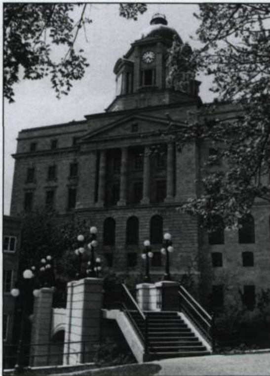
Réaménagé en 1914, le bureau de poste de Québec, est désigné depuis 1984 sous le nom d'édifice Louis-Saint-Laurent.

L'arrangement avait évidemment une saveur politique, au détriment de Stayner, qui protesta vigoureusement, alléguant qu'il aurait pu avoir beaucoup plus et réclama vainement la plus-value, vu que le terrain avait été acquis par lui uniquement pour servir au bureau de poste.