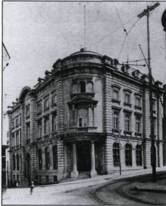
Bureau de poste érigé en 1872, selon les plans de l'architecte Pierre Gauvreau, au coin des rues Buade et Du Fort.

local permanent et mentionnait la nécessité de remplacer sans délai tout le matériel: formules, sceaux, papeterie, cachets et surtout les sacs de malle, barrures et balances. Ces derniers articles étant fabriqués en Angleterre, une réquisition à cet effet fut jointe à son rapport.