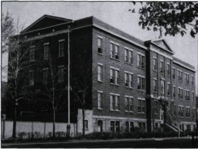
Vue du Collège Séraphique de Trois-Rivières où Marcel Trudel compléta la première moitié de son cours classique, de 1930 à 1935.

ce sens, j'avais réellement le sentiment de faire de l'histoire.