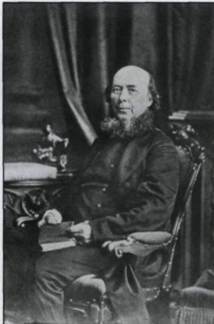
Charles Chéniquay, sujet d'une importante étude biographique de l'historien Trudel en 1955. (Photo: A. Boisseau, Archives du Séminaire de Québec).

MT – Il est dommage que dans les CE-GEPS on n'exige pas un diplôme élevé. On devrait exiger non seulement la maîtrise mais encourager le doctorat. À l'université, les postes sont tous remplis, de sorte que ceux qui préparent leur docto-