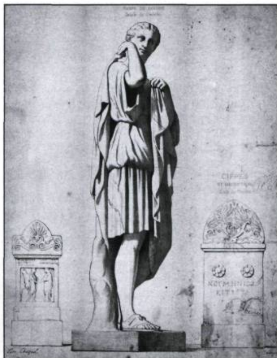
Lithographie de Cam. Chazal représentant Diane dite de Gabies. France, XIX ème siècle. (Archives du Séminaire de Québec).