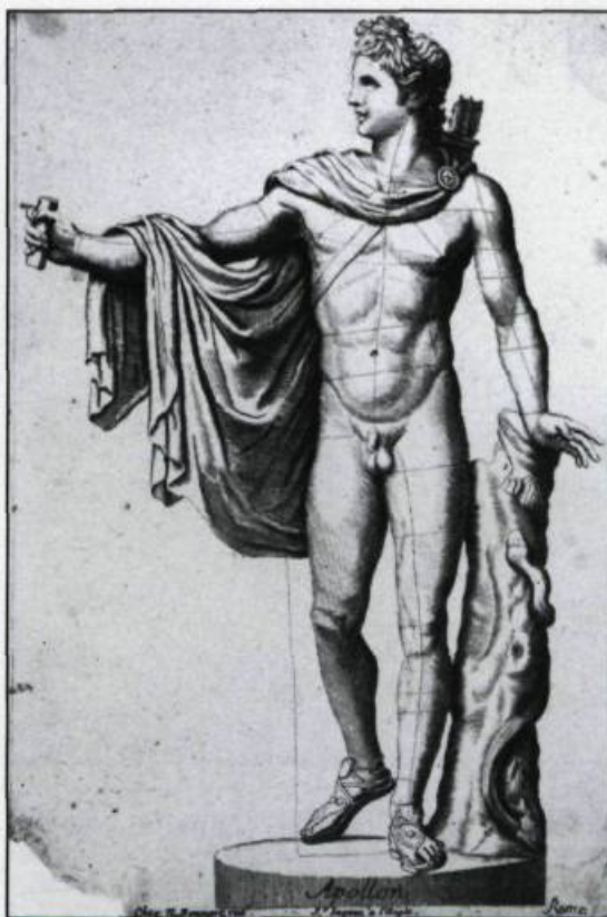
Le dieu Apollon, reconnu comme le symbole de la beauté, servait d'inspiration à l'enseignement du dessin. Eau-forte de Nicolas II Bonnart (?-1761). (Archives du Séminaire de Québec).

Viennent ensuite les modèles d'après les grands maîtres. Une imposante série du graveur De Poilly prouve l'importance de ce type de gravures dans la formation artistique. De Poilly s'est surtout attardé aux études anatomiques d'après Anibal Carrache et Nicolas Poussin. Les études et les paysages sont aussi bien représentés dans ce cartable. Les études se subdivisent en trois grandes sections: les têtes d'expression, les détails anatomiques, l'académie.