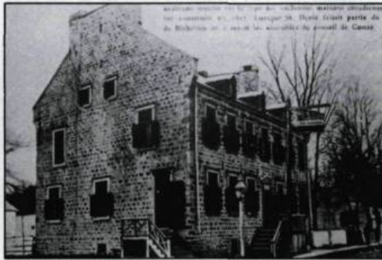
La maison du patriote Jean-Baptiste Mâsse au moment où elle abritait l'Hôtel Dragon (1910). (Maison nationale des Patriotes).

d'utilisation du bâtiment ont été envisagées tant par le ministère des Affaires culturelles que par les groupes en présence. En 1985, la corporation Les Patriotes du Pays s'est vu confier le mandat de superviser la mise en oeuvre du dernier concept de mise en valeur de la maison Mâsse. Ce concept s'articule autour de deux éléments distincts mais liés: la restauration – réhabilitation du bâtiment – et la mise en oeuvre d'un programme d'interprétation axé sur l'histoire des Patriotes. Le concept architectural mis de l'avant pour la restauration tient compte à la fois du caractère historique du bâtiment et des exigences fonctionnelles du programme d'interprétation et des services connexes.