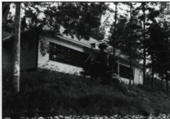
Photographie de la papeterie dans son état actuel. Ci-dessous, une esquisse de Cyril Simard montrant un projet de restauration prévu pour 1988. (Photo: Éric Parent).