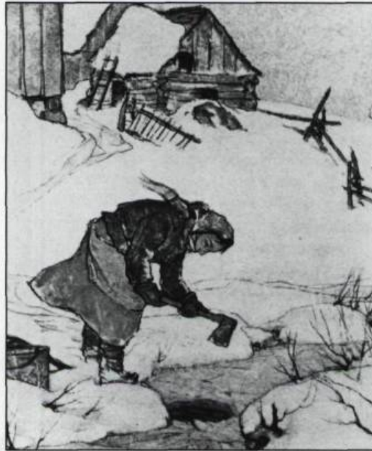
Maria s'appretant à puiser l'eau d'un ruisseau près de sa maison à Péribonka. Illustration de Clarence Gagnon pour l'édition du roman de Louis Hémon publiée chez Mornay à Paris en 1933.

cultée » par la religion. Menaud pousse son « cri » poétique et finit par « rouler les grains de son chapelet ». Mû par la révolte d'abord, il passe de la montagne au « bois hostile », et il rejoint ainsi le thème de l'errance canadienne-française: « cette fête-là n'était pas pour lui. Il n'était qu'un intrus maintenant, un rôdeur sombre, furtif, le dépossédé revenu, malgré les lois, s'emplit une dernière fois les yeux au bord de la fête interdite ».