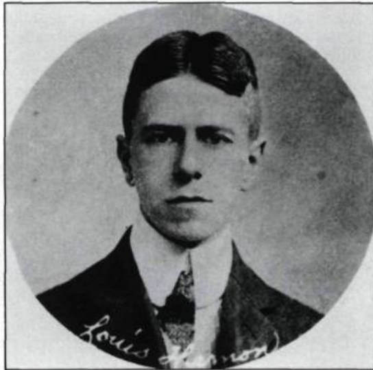
Photographie de Louis Hémon, auteur du roman à succès Maria Chapdeleine.

choix. La pression idéologique se fait sentir de manière dualiste dans Menaud : trahir, ou obéir au nom d'un « ordre des choses » établi. Marie renvoie le Délié et le récit précise: « Sa maison [à Menaud] lui était demeurée fidèle, inébranlable sur les fondements que, dans l'ordre, avaient posés les grands morts, les plus humains d'entre les humains, ses pères... » L'ajout en italique, emprunté en partie à Hémon, trahit ici la ligne d'autorité.