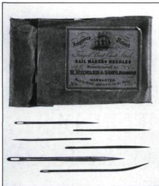
Aiguilles appartenant à un artisan voilier irlandais établi à Québec au début du XIX e siècle. (Musée canadien des civilisations).

Après 1760, les Britanniques remplacent les Français dans le contrôle du grand commerce. C'est ainsi que la plupart des Canadiens sont écartés du commerce d'exportation et d'importation en