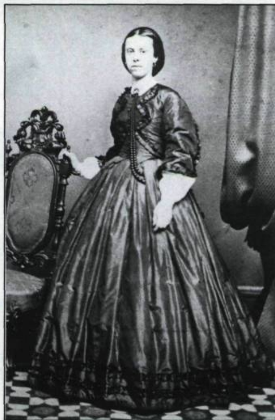
Carte de visite réalisée par Ellisson et Co. en 1865. (Collection de l'au- teur).

Comme photographe professionnel, j'ai été amené à m'intéresser aux valeurs documentaires, artistiques et techniques des images anciennes. Bien des pratiques en photographie actuelle, telles que le photomontage, le panoramique, la photo fiction, les superpositions, étaient utilisées couramment dès le milieu du siècle dernier. Et la stéréographie avec ses images tridimension-