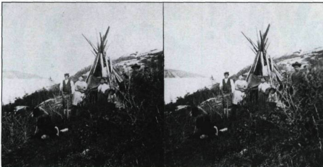
Indiens à Tadoussac photographiés par Louis- Prudent Vallée vers 1870. (Collection de l'au- teur).