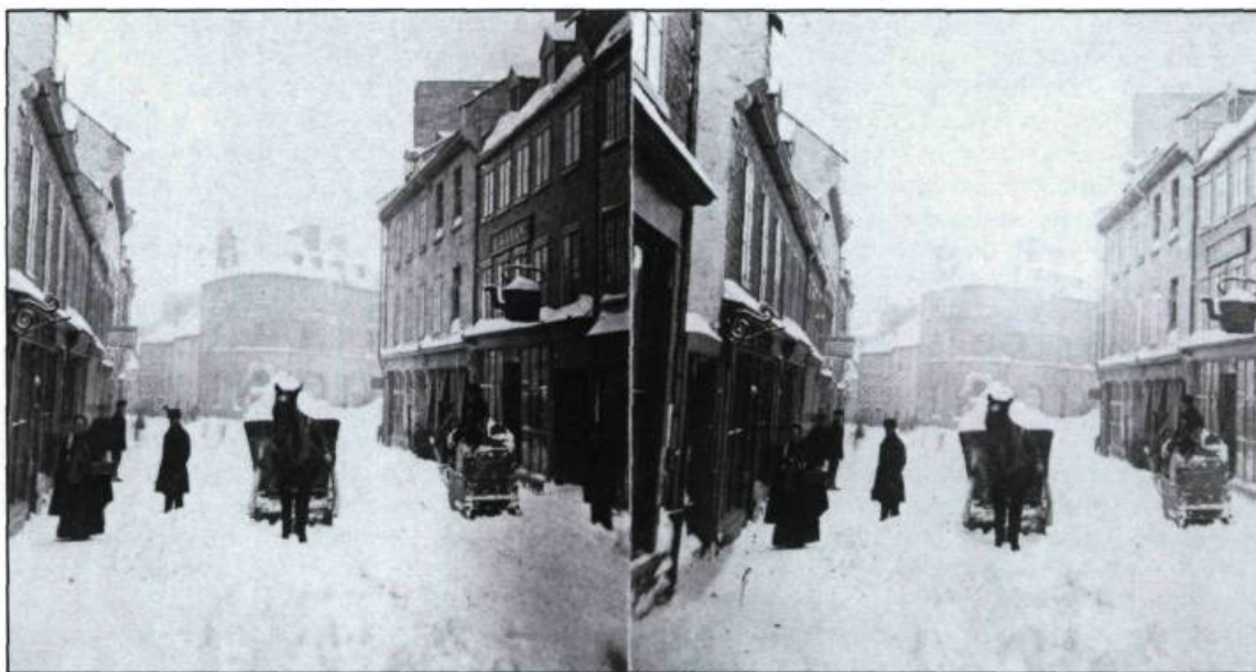
Stéréogramme de 1870 illustrant une scène de déneigement au lendemain d'une tempête. En arrière-plan, l'édifice Livernois situé à l'encoignure des rues Couillard et Garneau. (Collection de l'auteur).

Pour rassembler une bonne collection, il faut avoir une connaissance du sujet, ce qui s'acquiert progressivement. On augmente d'autant nos chances de dénicher des modèles rares, et on peut aussi mieux évaluer le prix à payer pour telle ou telle image.