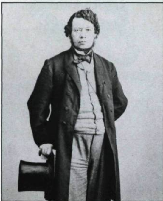
Portrait de Thomas D'Arcy McGee. (Collection de l'auteur).

Les stéréogrammes constituent des pièces de collection très attrayantes pour leur valeur historique et esthétique. Les portraits sur cartes de visite ainsi que les cabinets sont des éléments également très intéressants, beaucoup plus faciles à trouver, et la plupart du temps clairement identifiés du nom du photographe et souvent du sujet.