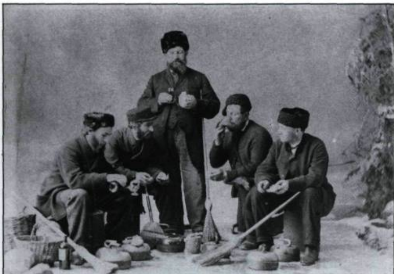
Photographie de W. Notman montrant des joueurs de curling de Montréal en 1867. (Collection de l'auteur).

Unis que l'on a le plus de chance de trouver, à des prix accessibles, de magnifiques vues de Québec. Ces photographies étaient à l'époque vendues à des touristes et aux nombreux Québécois qui y ont immigré.