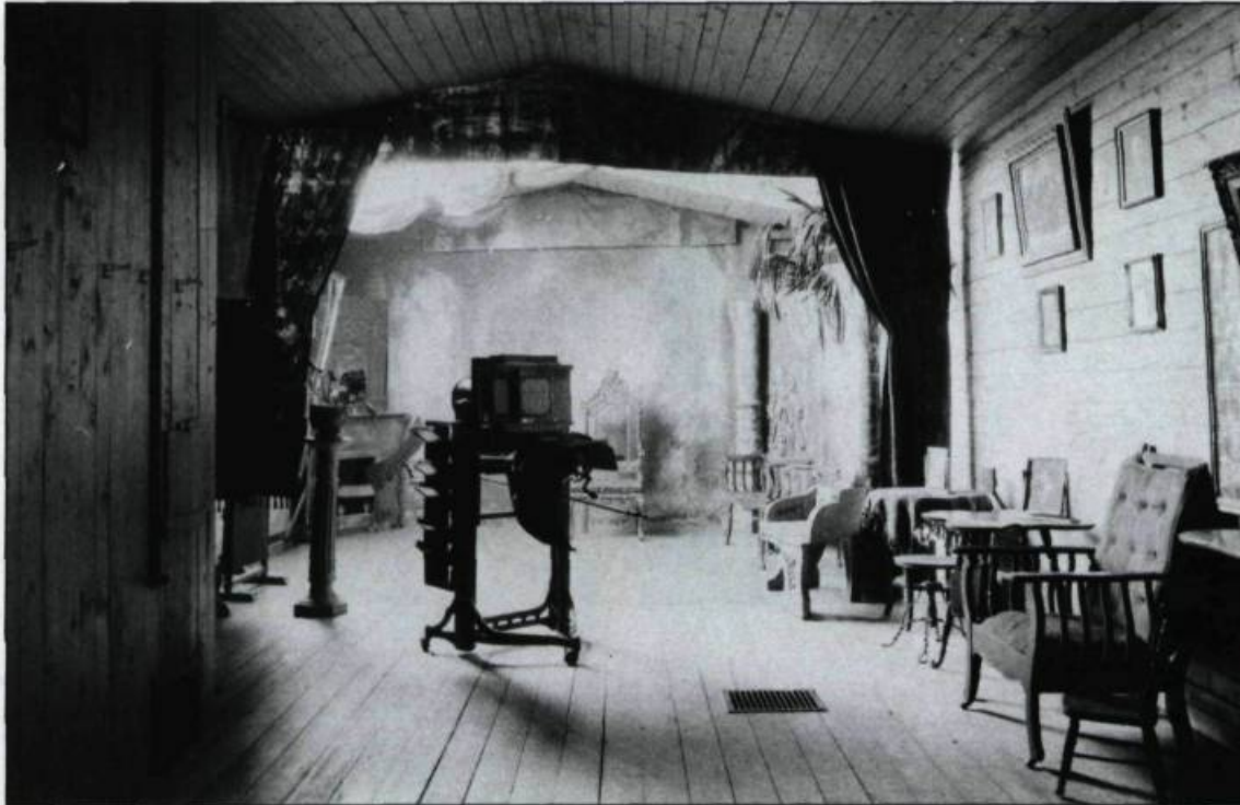
Intérieur du studio du photographe Z. Pagé à Saint-Raymond de Portneuf vers 1900.