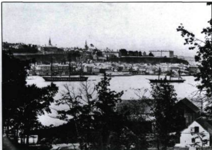
À gauche, photographie de Livernois et Bienvenu en 1870 et montrant une vue de Québec prise de Lévis. À droite, on en a tiré une gravure qui, mise à jour, a été reproduite dans l' Opinion publique du 14 décembre 1882.