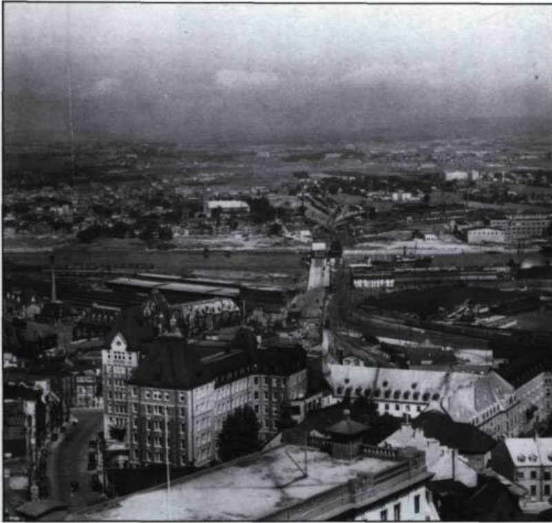
Vue montrant le complexe de l'Hôtel-Dieu vers 1935. À l'arrière-plan, la gare du Palais et la rivière Saint-Charles.

temps inégaux dans la qualité des résultats obtenus. Il ne connut pratiquement pas l'usage des premiers films en couleurs qui n'étaient pas encore au point à leur sortie sur le marché en 1942.