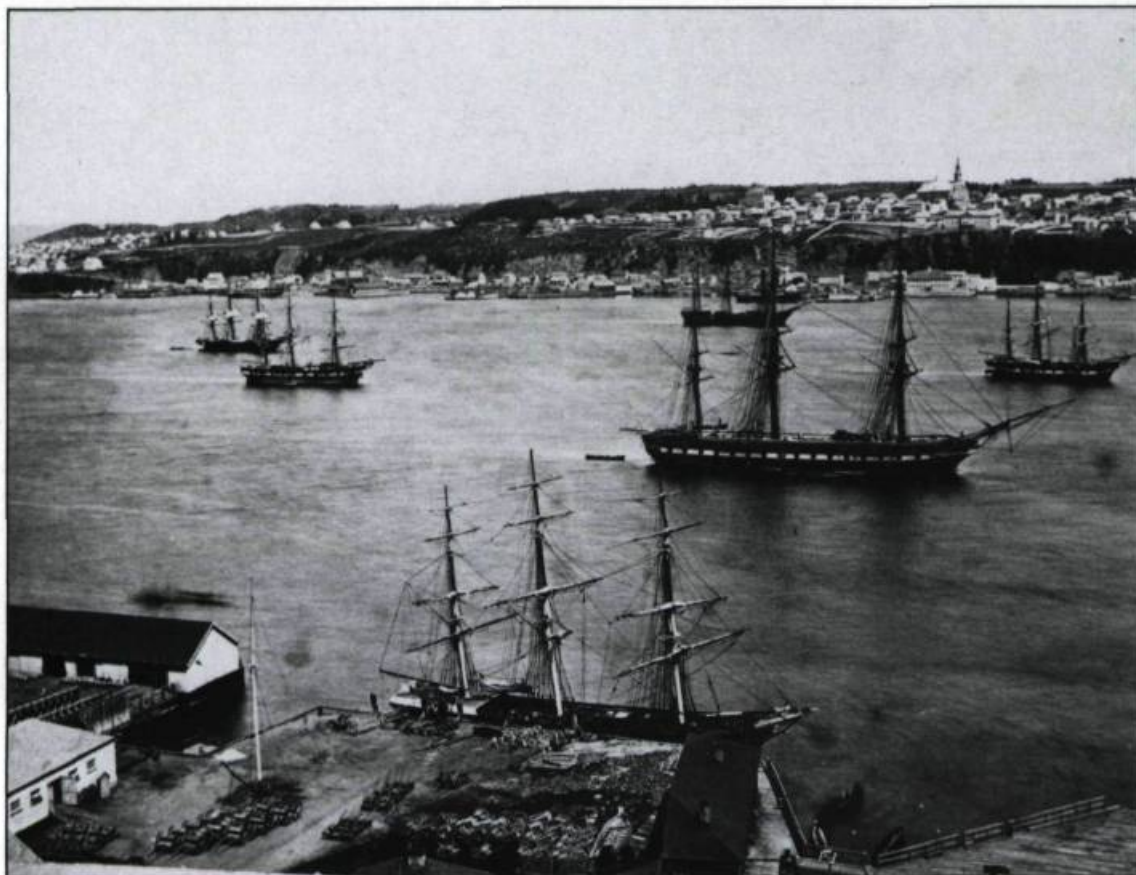
Quai de la Reine vu de la haute ville de Québec, vers 1870. En arrière-plan, nous remarquons la pointe de Lévis.